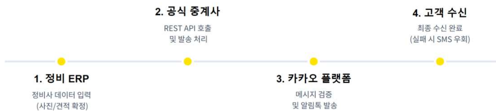
[API 게이트 웨이 연동 구성 진행도]